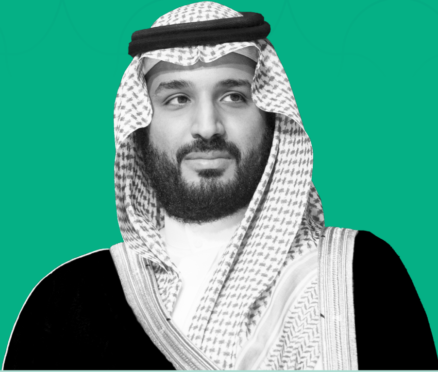
صاحب السمو الملكي الأمير محمد بن سلمان بن عبدالعزيز (حفظه الله) ولي العهد، نائب رئيس مجلس الوزراء، وزير الدفاع