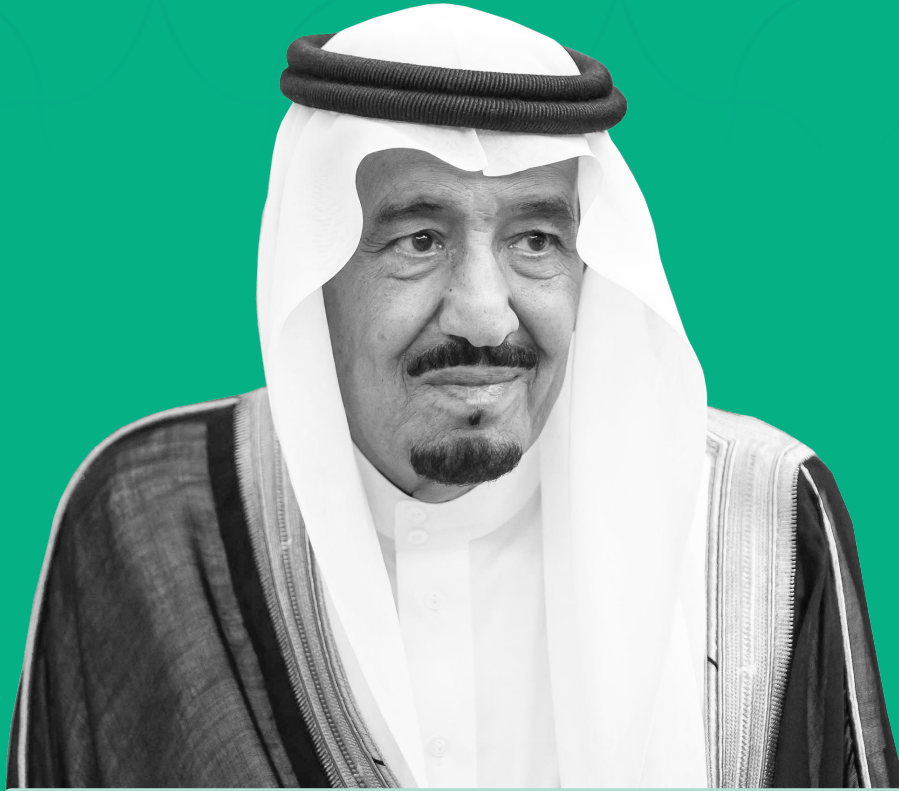
خادم الحرمين الشريفين الملك سلمان بن عبد العزيز آل سعود (حفظه الله)